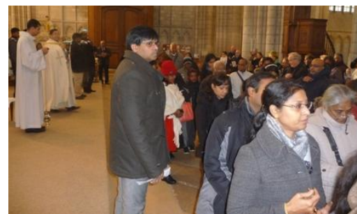
Les fleurs de jasmin ont été jetées sur les parcours en signe de bénédiction.