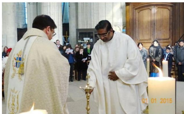
Les célébrants allument les 5 bougies qui se trouvent dans le chœur, symbolisant les 5 continents